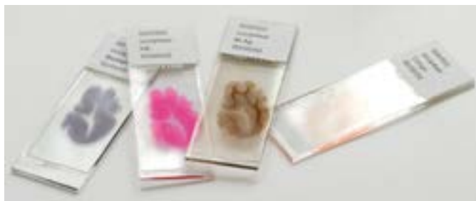
Figuur 1: De neuropatholoog bekijkt hele dunne plakjes (8 duizendste millimeter) hersenweefsel onder de microscoop (coupes). De glaasjes zijn in werkelijkheid 2 x zo groot als op de foto. De coupes worden zo gekleurd dat afzonderlijke structuren goed van elkaar te onderscheiden zijn.

Om het proces administratief te versnellen, kiest de NHB er tegenwoordig in de meeste gevallen voor