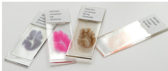
Figuur 2: De neuropatholoog bekijkt hele dunne plakjes (8 duizendste millimeter) hersenweefsel onder de microscoop (coupes). De glaasjes zijn in werkelijkheid 2 x zo groot als op de foto. De coupes worden zo gekleurd dat afzonderlijke structuren goed van elkaar te onderscheiden zijn.

De ingreep gebeurt via de achterzijde van het hoofd. Wat nog zichtbaar is, is een litteken, laag over het achterhoofd, van oor tot oor. Omdat het een ingrijpende