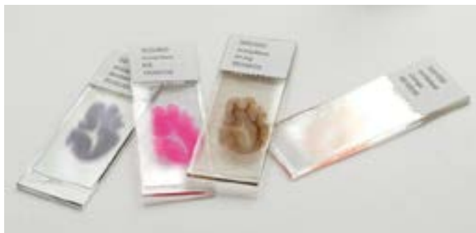
Figuur 2: De neuropatholoog bekijkt hele dunne plakjes (8 duizendste millimeter) hersenweefsel onder de microscoop (coupes). De glasjes zijn in werkelijkheid 2 x zo groot als op de foto. De coupes worden zo gekleurd dat afzonderlijke structuren goed van elkaar te onderscheiden zijn.

De ingreep gebeurt via de achterzijde van het hoofd. Wat nog zichtbaar is, is een litteken, laag over het achterhoofd, van oor tot oor. Omdat het een ingrijpende operatie betreft, is het in verband met nazorg noodzakelijk dat de overledene minstens 8 uur nablijft.