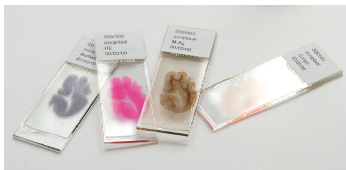
Figuur 2: De neuropatholoog bekijkt hele dunne plakjes (8 duizendste millimeter) hersenweefsel onder de microscoop (coupes). De glasjes zijn in werkelijkheid 2 x zo groot als op de foto. De coupes worden zo gekleurd dat afzonderlijke structuren goed van elkaar te onderscheiden zijn.