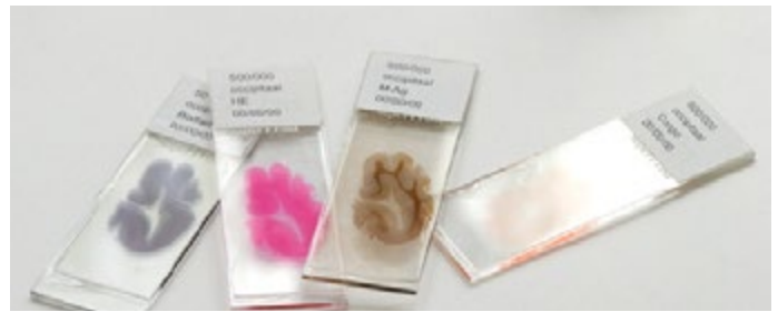
Figuur 2: De neuropatholoog bekijkt hele dunne plakjes (8 duizendste millimeter) hersenweefsel onder de microscoop (coupes). De glaasjes zijn in werkelijkheid 2 x zo groot als op de foto. De coupes worden zo gekleurd dat afzonderlijke structuren goed van elkaar te onderscheiden zijn.