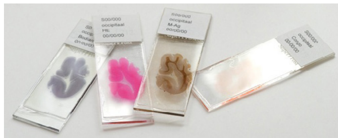
Figuur 2: De neuropatholoog bekijkt hele dunne plakjes (8 duizendste millimeter) hersenweefsel onder de microscoop (coupes). De glaasjes zijn in werkelijkheid 2 x zo groot als op de foto. De coupes worden zo gekleurd dat afzonderlijke structuren goed van elkaar te onderscheiden zijn.

De ingreep gebeurt via de achterzijde van het hoofd. Wat nog zichtbaar is, is een litteken, laag over het achterhoofd, van oor tot oor. Omdat het een ingrijpende operatie betreft, is het in verband met nazorg noodzakelijk dat de overledene minstens 8 uur nablijft. De verzorging en het kleden vinden plaats na de